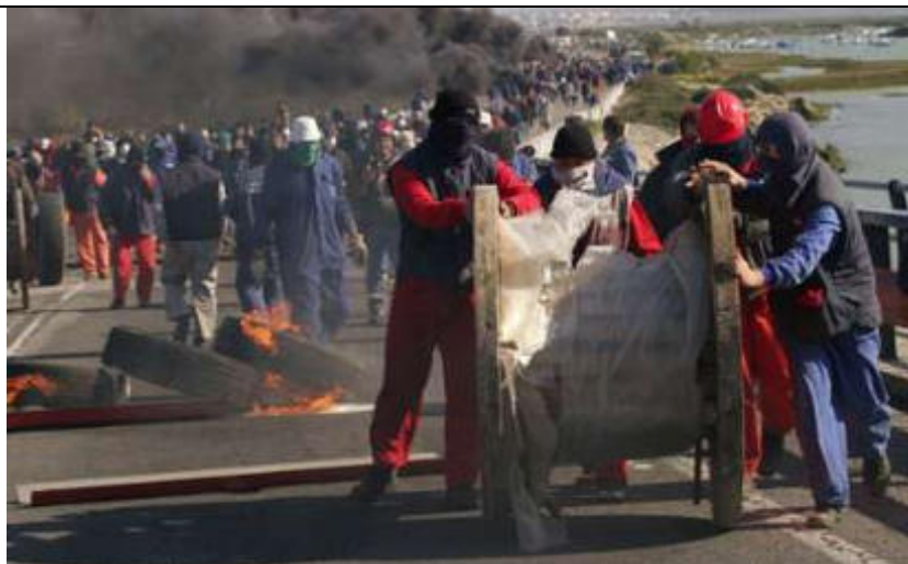
نمونه ای از نبرد برون محلی در مبارزات کارگری اسپانیا

تصویر روبرو کارگران اسکله ها در اسپانیا را نشان می دهد که برای اعتراضگری یک جاده ی مهم ساحلی را با لاستیک های آتش زده و قرقره های کابل بسته و در مقابل یورش پلیس به مقابله برخاسته اند.